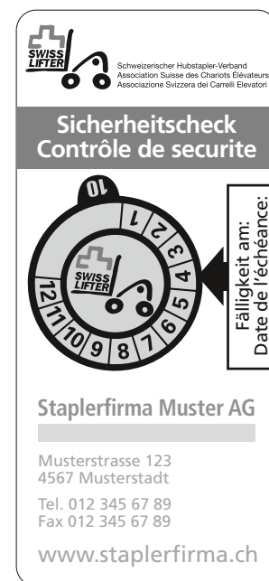
7 Vignette als Instandhaltungshinweis