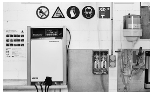
5 Vorschriftsgemäss ausgerüstete Ladestation mit Sicherheitszeichen und Augendusche. Geschlossene Schutzbrille und säurefeste Handschuhe sind griffbereit.